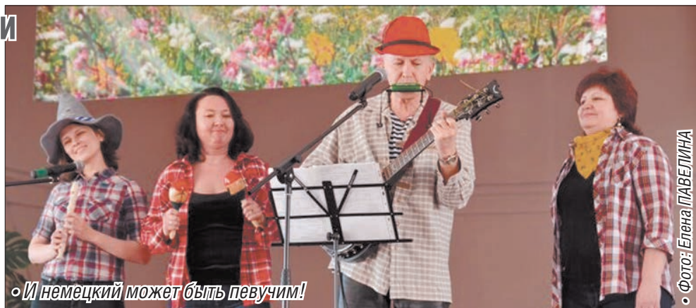
«И немецкий может быть певучим!»

Среди взрослых участников фестиваля лучше всех показал себя ансамбль немец-